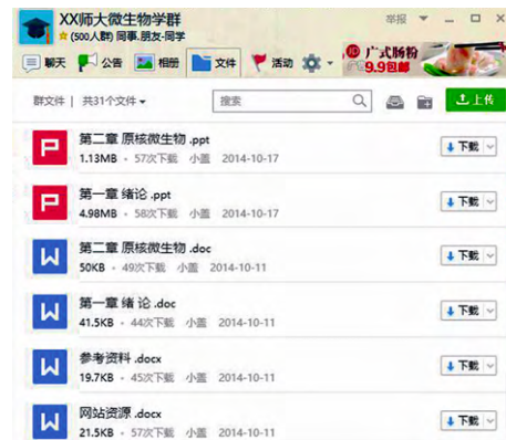
图 2 QQ 群中学生下载资料情况示例图

教师根据课程进度将与课程相关的资料(包括 Word 文件、PowerPoint 文件及教学视频)和习题上传至群文件，实现资源共享。师生之间、学生之间通过群文件夹、QQ 一对一文件传输共享资料，加快了信息传播的速度，节省了信息传播的时间。图 2 为本研究 QQ 群中学生下载资料情况。从图 2